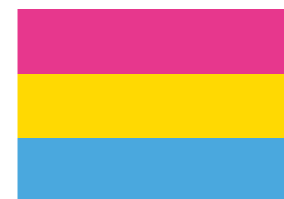
Flagge der Pansexuellen

BiNe – Bisexuelles Netzwerk e. V. existiert seit 1992 und vernetzt, wie der Name schon sagt, Bisexuelle miteinander, z. B. über Gruppenlisten, die Internetseite www.bine.net oder auch durch die deutschlandweiten Bi-Treffen. BiNe setzt sich für Aufklärung und Toleranz ein, bietet Beratung, unterstützt Bi-Aktivitäten (z. B. auf CSDs) und ermöglicht dieses Magazin.