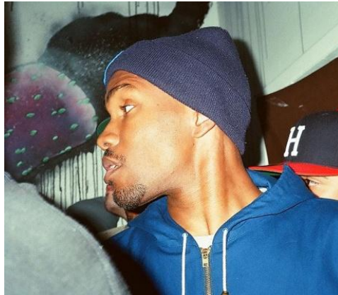
HipHop-Musiker Frank Ocean