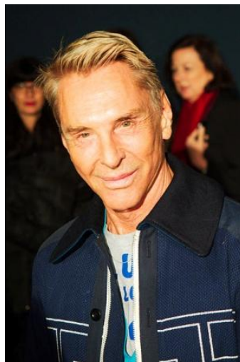
Modedesigner Wolfgang Joop

Quellenangaben siehe Lehrer_innen-Hinweise