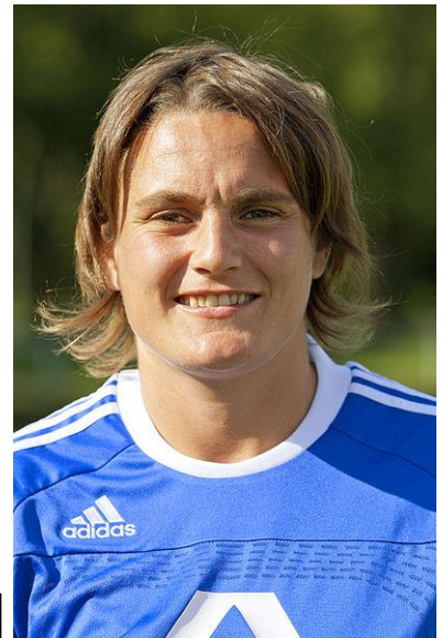
deutsche Bundes-Torwartin Nadine Angerer