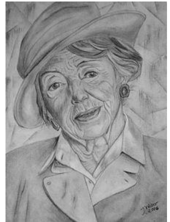
verstorbene deutsche Schauspielerin Inge Meysel