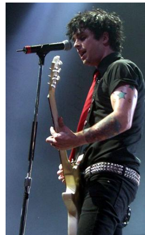
Green Day- Musiker Billie Joe Armstrong