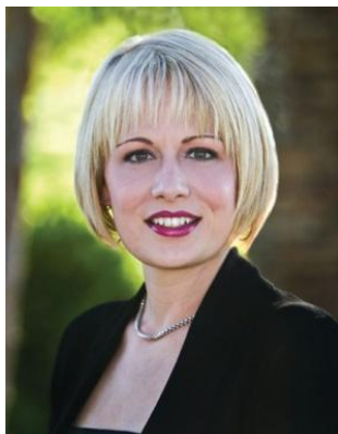
US-Politikerin Kyrsten Sinema