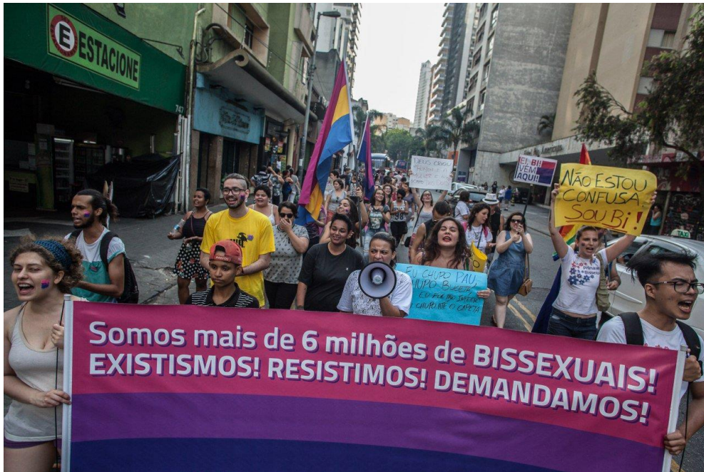
1 st Bisexual Visibility Walk (2017).